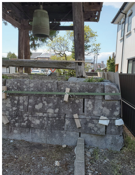
(崩落の危機に瀕している鐘楼)